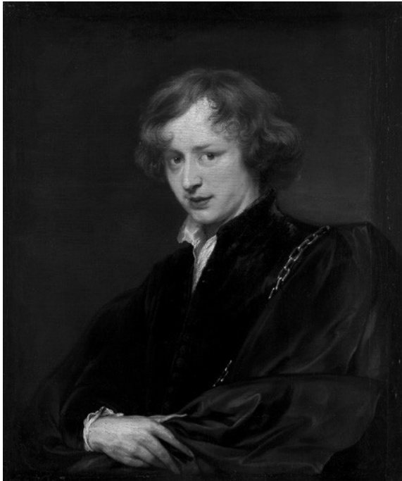
Antony van Dyck önarcképe (1621)