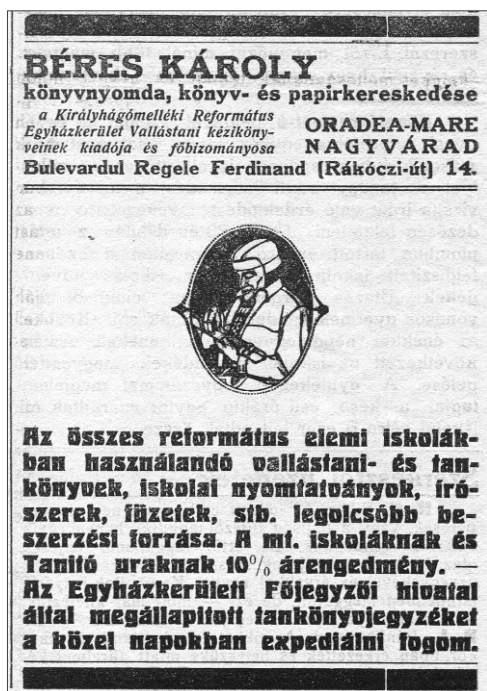
Béres Károly könyvnyomdájának reklámja ( Egyházi és Iskolai Szemle – 1924. augusztus)

tus Naptár kiadásával járó teendőket végezni készek. A közös alkotást kísérje Isten áldása[...].” 21