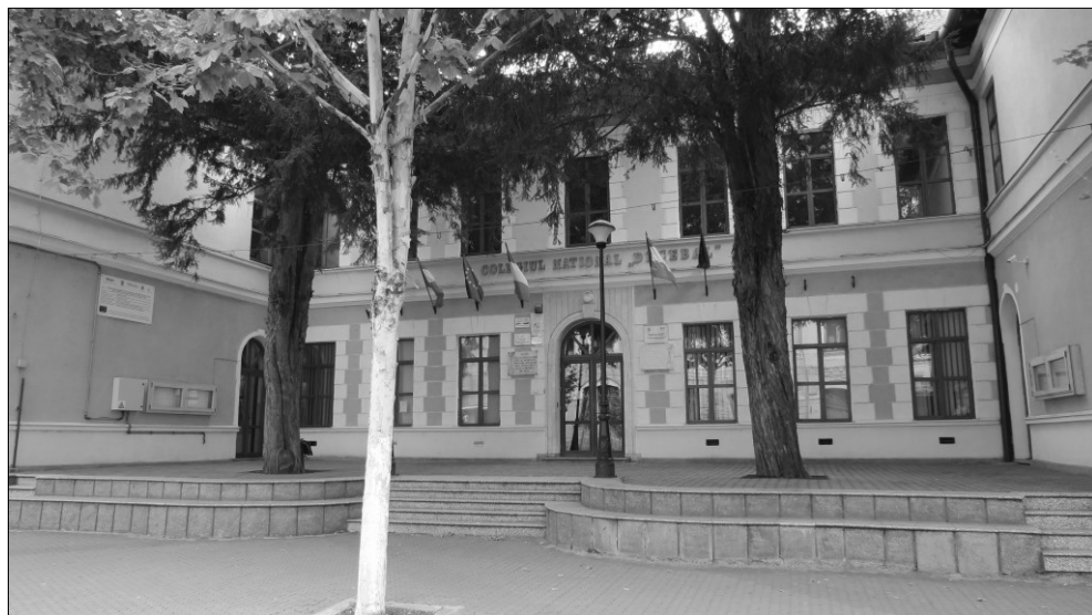
A dévai Magyar Királyi Állami Főreáliskola, napjainkban a Decebal Nemzeti Kollégium épülete

Munkája elismeréseként 1888-ban a Magyar Tudományos Akadémia levelező tagjai közé választotta. Tagja volt az Erdélyi Kárpát-Egyesületnek, a Földrajzi Társulatnak, az Országos Embertani és Régészeti Társulatnak, a Magyar Néprajzi Társulatnak, 1896-tól pedig az Országos Közoktatási Tanácsnak. 1898-ban