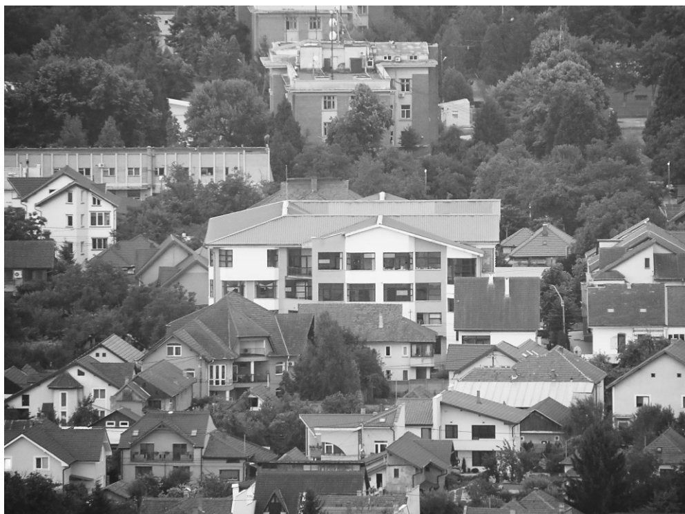
A Tégla Gábor Elméleti Líceum madártávlatból.

Lelkesen szerkesztette az 1892-ben beinduló, Erdély című „turista-, fürdőügyi és néprajzi” folyóirat turisztikai rovatát, de közölt természettudományi és geológiai cikkeket is.